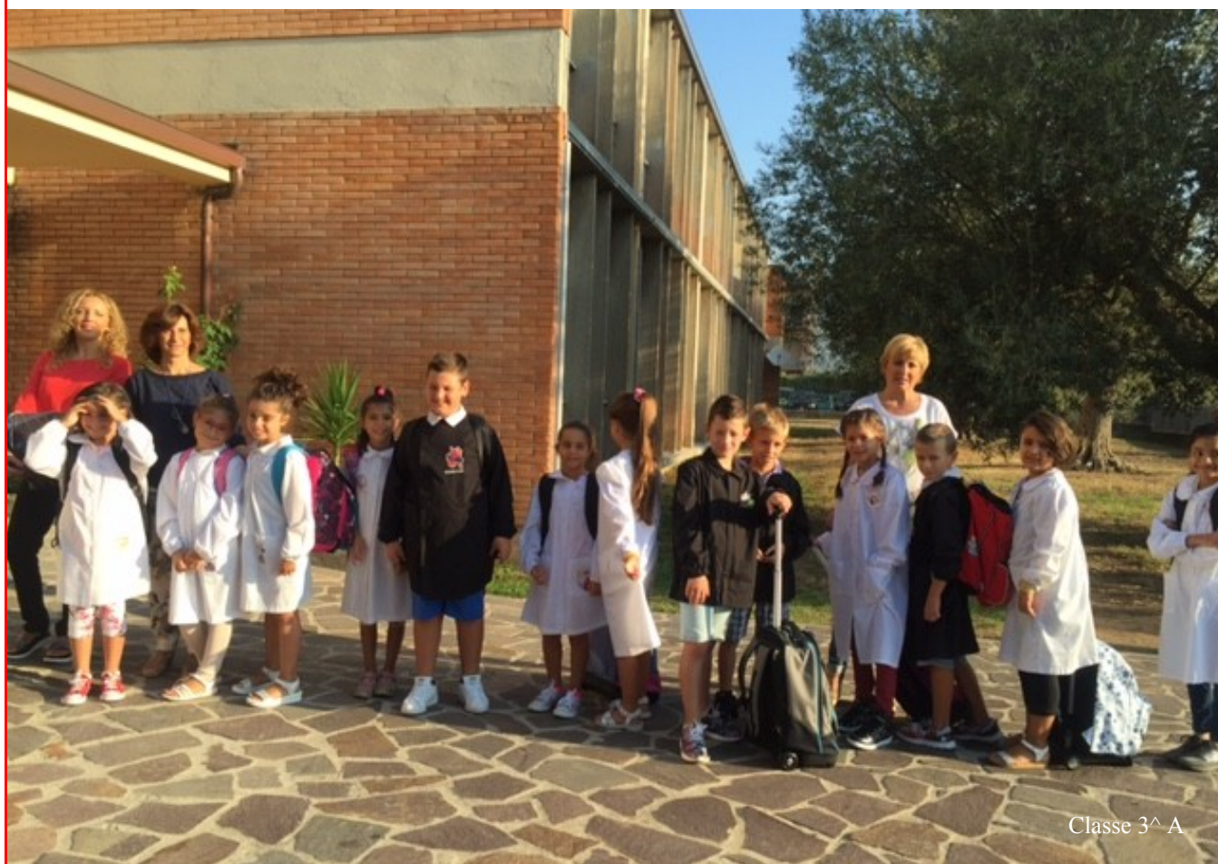
Classe 3^ A