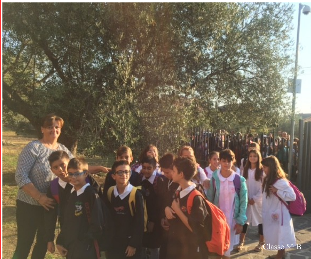
Classe 5 B

I grembiuli bianchi e neri, che oggi gli alunni indossano sugli abiti estivi, hanno la loro importanza e contribuiscono a far sentire tutti membri di una stessa comunità. La cura di queste "divise" è un impegno che le famiglie assolvono scrupolosamente per la durata dell'intero anno scolastico.