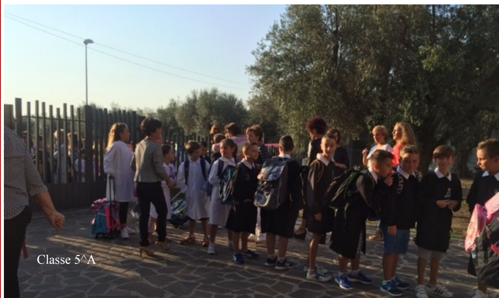
Classe 5 A

Docente coordinatore della redazione Funzione Strumentale Fontana Rita