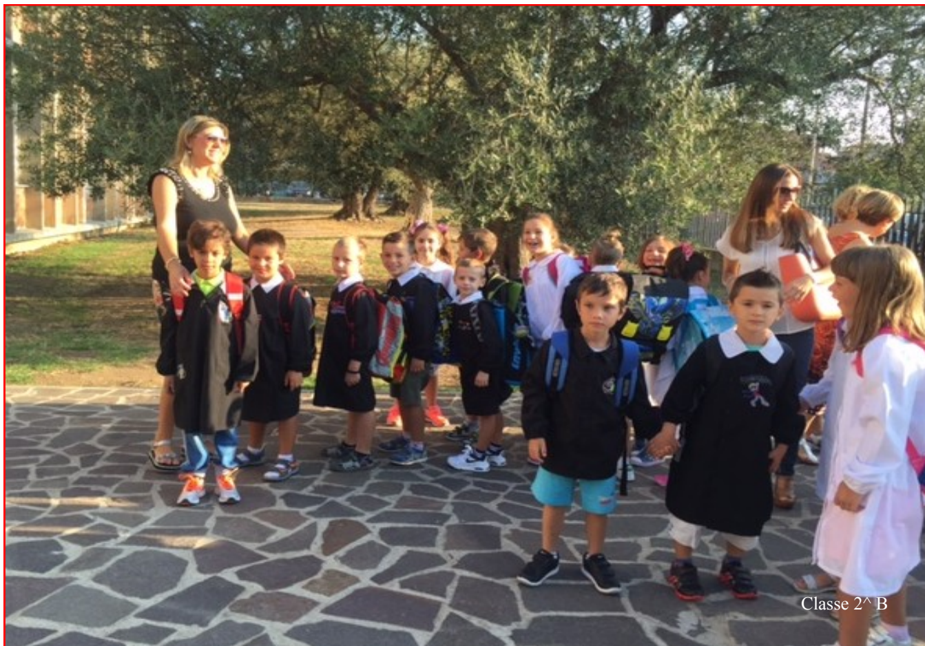
Classe 2^ B