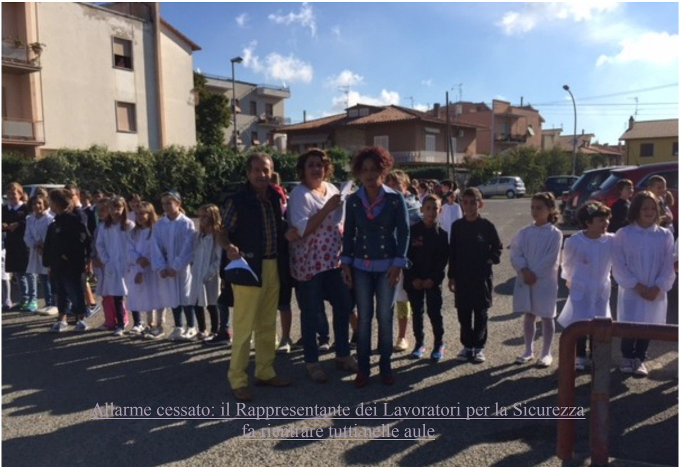
Allarme cessato: il Rappresentante dei Lavoratori per la Sicurezza fa rientrare tutti nelle aule