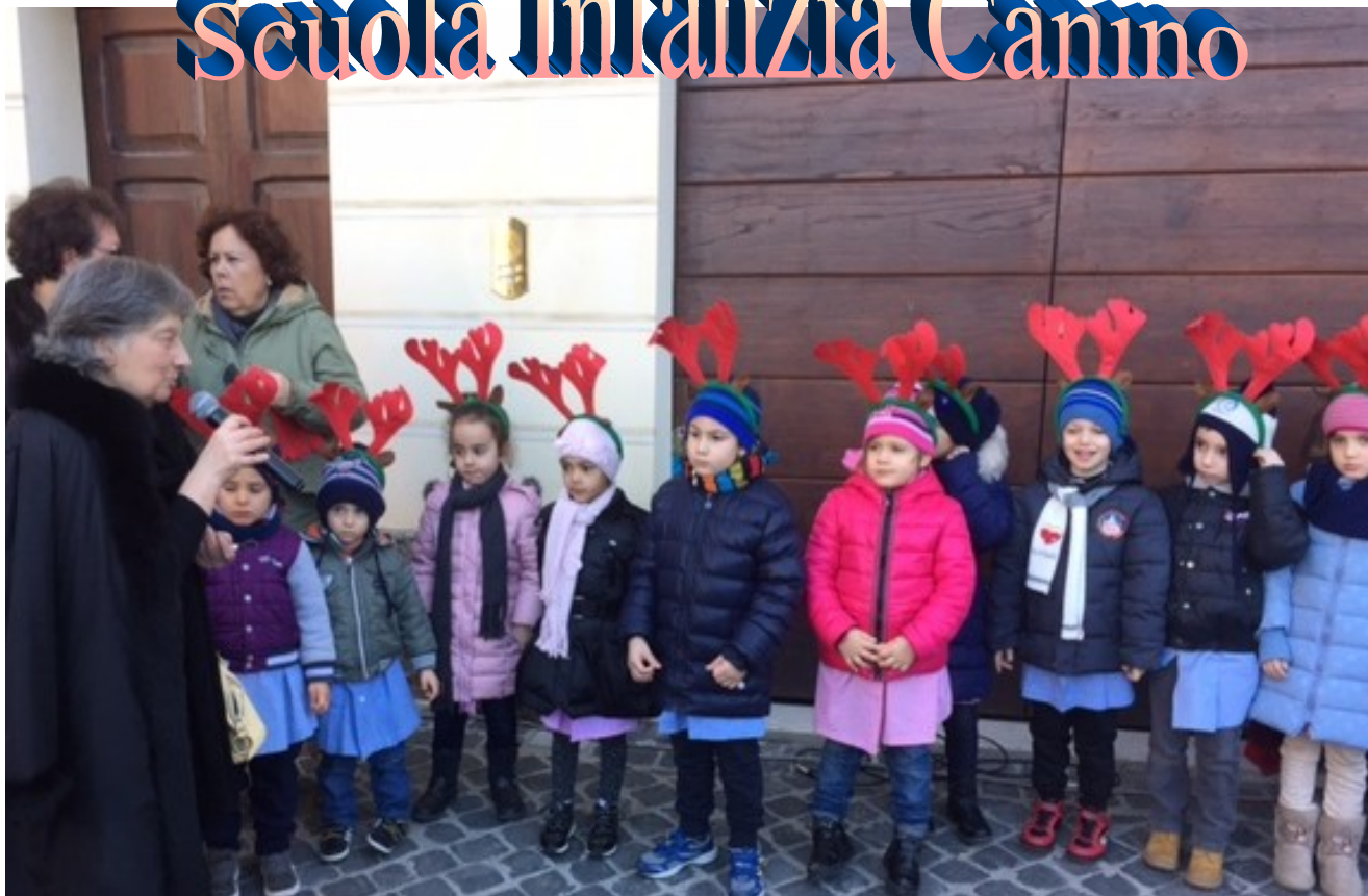
Recita in "Piazza dell Rocca", oggi piazza G. Mazzini