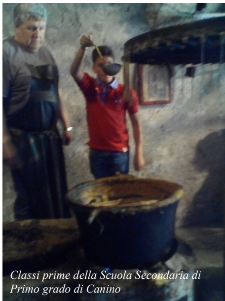
Classi prime della Scuola Secondaria di Primo grado di Canino